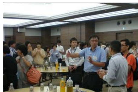
多職種交流会も賑やかに行われました！

事例検討会では、発表者が実際に経験した症例（下表参照）が取り上げられ、苦労した点や工夫した点などを交えた実践的な発表が行われました。検討会終了後に開いた多職種交流会は、関係者同士の「顔の見える関係づくり」の機会となりました。