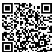
ACP勉強会 ホームページ