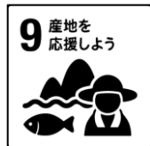
農林水産省作成 食育ピクトグラムより