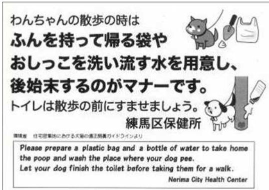
【A】 A4 白