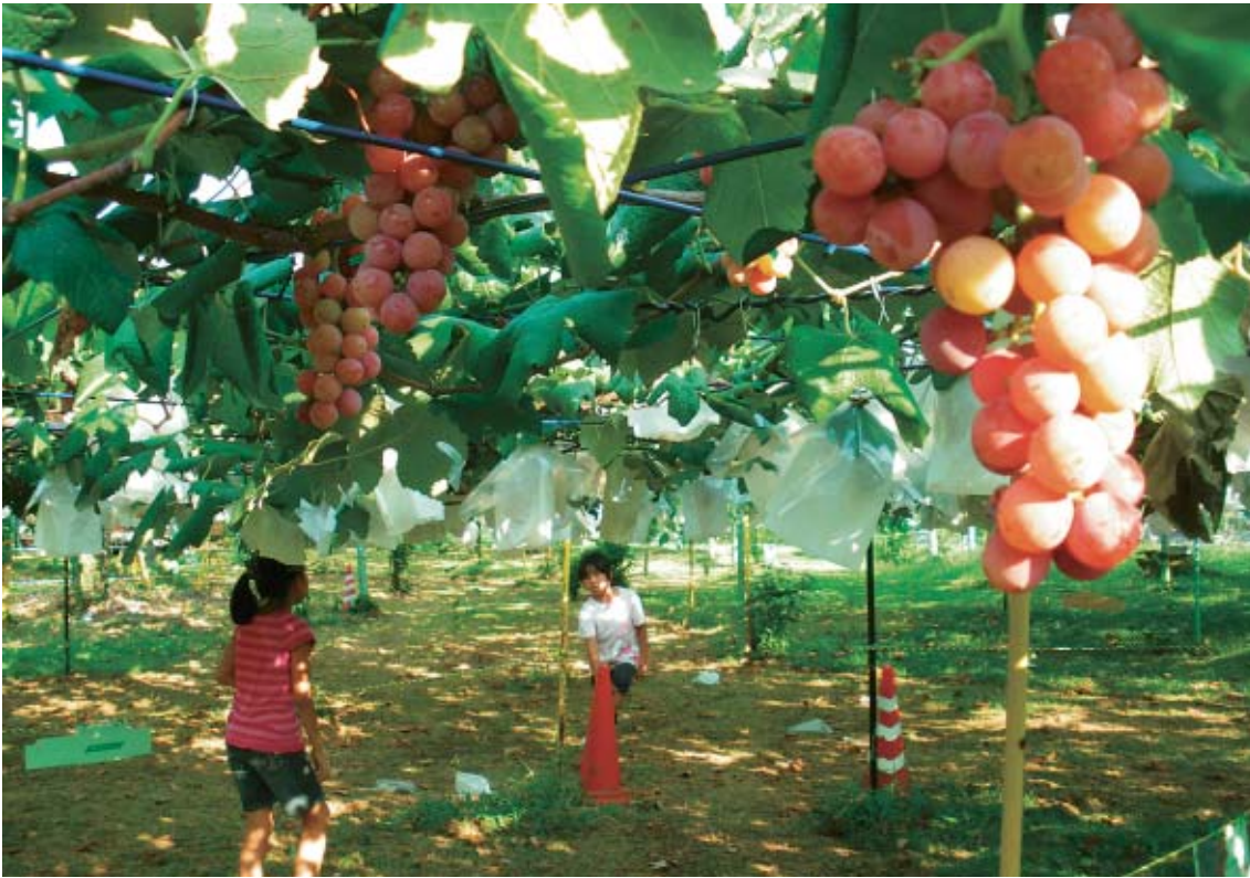
ぶどう狩りを楽しむ子どもたち（鹿島ぶどう園 春日町6-7-4）

編集・発行 練馬区議会 〒176-8501 練馬区豊玉北六丁目12番1号 電話(3993)1111(代) FAX(3993)2424 http://www.city.nerima.tokyo.jp/gikai/