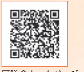
区議会ホームページ