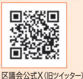
区議会公式X(旧ツイッター)