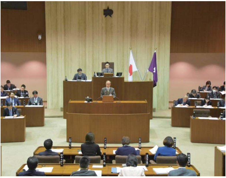
本 会 議

◆令和2年度練馬区公共駐車場会計予算 予算額4億5,592万4千円 ◆練馬区印鑑条例の一部を改正する条例