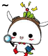
練馬区公式アニメキャラクター 「ねり丸」 ©練馬区

区独自の制度として、通年（夏・冬・春休みも含む）で11時間保育を実施する私立幼稚園（認定こども園を含む）を「練馬こども園」として認定しています。