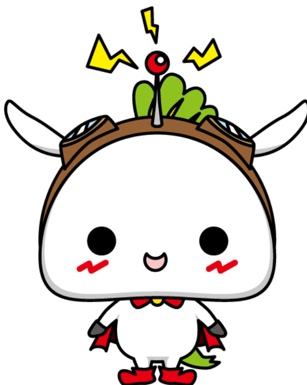
練馬区公式アニメキャラクター ねり丸 ©練馬区