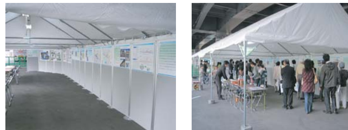
▶▲オープンハウスの様子

平成22年10月に石神井公園駅北口の高架下にてオープンハウスを開催し、「高架下の公共利用方針案」と「石神井公園駅駅前広場の設計案」のお知らせ等を行い、地域の皆様からご意見やご要望を伺いました。