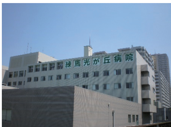
▲旧練馬光が丘病院（外観）