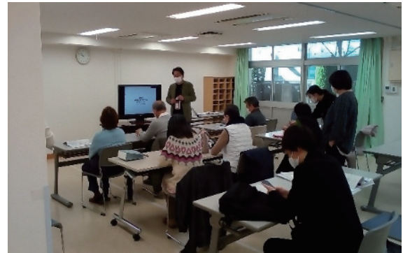
▲町会・自治会向け講習会の様子

課題解決に向けた助言等を行うコンサルタントの派遣など、各町会・自治会の状況に合わせたきめ細やかな支援を行うために相談体制の強化に取り組めます。