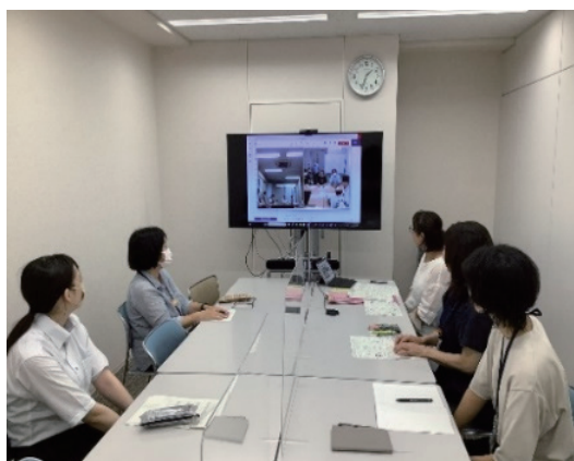
▲都区合同会議の様子