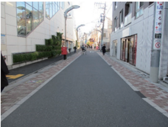
▲密集事業により整備した道路 (江古田北部地区)