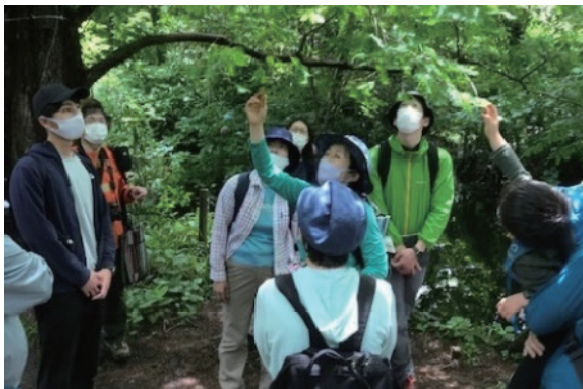
▲森林浴体験を通して区内のみどりの魅力を発信 (ねりまのみどりってこんなに素敵！プロジェクト)