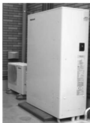
自然冷媒ヒートポンプ給湯器(エコキュート)