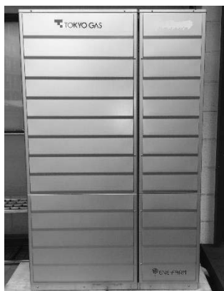
家庭用燃料電池システム(エネファーム)