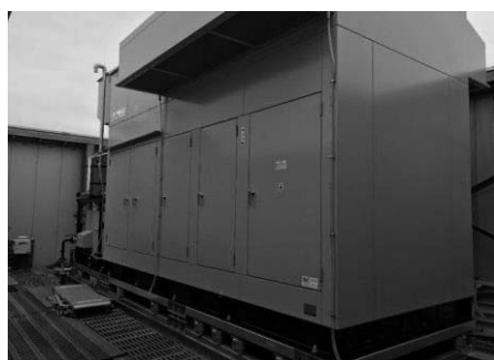
順天堂大学医学部附属練馬病院に設置したコジェネレーションシステム

令和2年度に、順天堂大学医学部附属練馬病院と石神井東中学校との間で運用を開始しました。令和4年度には、公益社団法人地域医療振興協会練馬光が丘病院と光が丘秋の陽小学校との間で運用を開始する予定です。