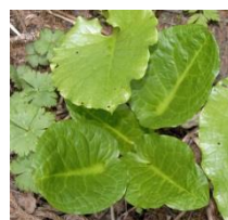
若い葉(左上1枚は別植物)