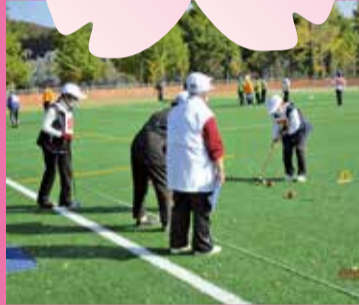
城西ブロックゲートボール大会

5人×5人の対抗戦で1競技30分。第1、第2、第3ゲートを通り合計25点(満点)を競う頭脳とチームワークが重要な競技。