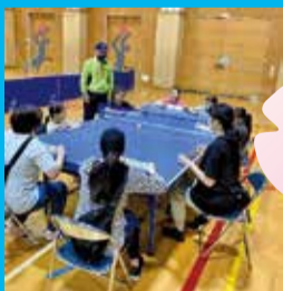
ユニバーサルスポーツチャレンジ