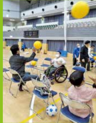
「レクリエーションスポーツの祭典」

練馬区レクリエーション協会では毎年、光が丘体育館で「レクリエーションスポーツの祭典」を行っています。祭典のサブタイトルは「障がいのある人もない人も一緒に遊ぼう」です。毎年、高齢者の方から小さいお子さんを連れたパパやママ、車いすの方など、あらゆる方々が様々なレクリエーションスポーツを無理なく楽しく体験できます。