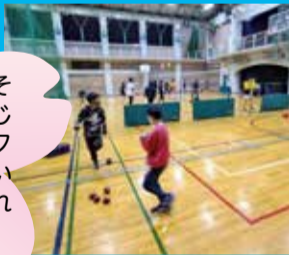
日曜定例スポーツ

赤、青のボールをそれぞれ6球ずつ投じて、白いジャックボール(目標球)にいくかに多く近づけられるか競うスポーツ。