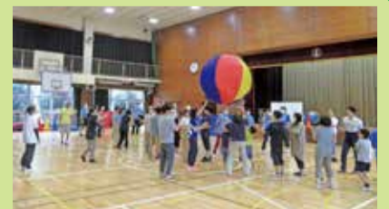
スポーツ・レクリエーション教室

このほか、各団体が開催しているイベントや教室の詳細は2・3面や4面の問合せ先までご連絡ください!