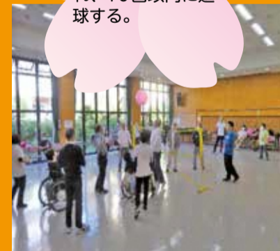
障害者スポーツ交流会