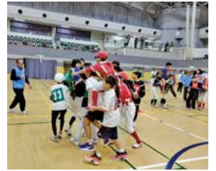
少年少女大運動会