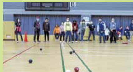
ポッチャ交流大会

区では、障害のある人もない人もともにスポーツに親しむきっかけづくりの場として「スポーツ・レクリエーション教室」でのしっぽとりゲーム、ディスゲッター、エアートランポリン、ペガーボールや「ポッチャ交流大会」を開催しています。令和6年度「ポッチャ交流大会」は、8月28日(水)に光が丘体育館で実施します。応援にいらしてください。