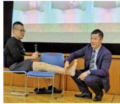
スポーツ指導者研修会 「ケガ予防等に役立つテーピング」

当協会は加盟団体38団体とスポーツ少年団14団体で組織された、練馬区における競技スポーツを統括する団体です。研修会や運動会など、様々な活動を行っております。