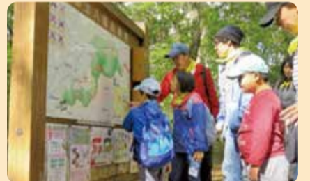
アウトドア体験会