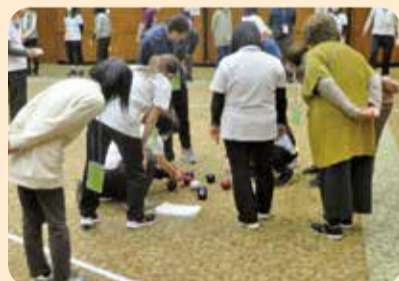
ポッチャを広めよう！