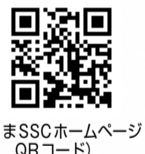
(ねりまSSCホームページQRコード)