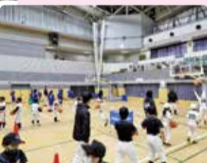
少年少女スポーツふれあいひろば