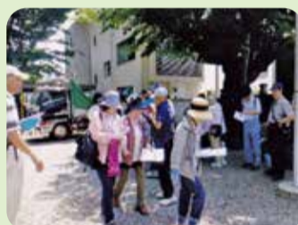
ウォークラリー研究会