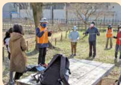
アウトドア体験会