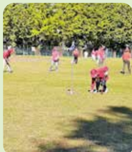
グラウンドゴルフ協会

レクリエーションは、人の心を元気にしてくれます。練馬区レクリエーション協会では、いろいろな活動を通して、年齢や障がいをおぼえず区民の皆様へレクリエーションの楽しみや喜びを感じていただき、心を元気にし、健康増進と生きがい作りにつながっていただければと考えています。