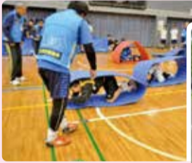
少年少女大運動会

体育協会主催の少年少女大運動会や傘下育成団体の練馬区スポーツ少年団14種目による多種多様なスポーツ活動を通じて、子どもたちの運動習慣や体力技術の向上、仲間づくりに取り組んでいます。本格的にスポーツに取り組みたい子どもたちの参加をお待ちしております。