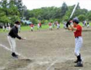
少年少女野球教室