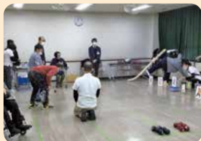
スポーツを楽しもう！ みんなでいっしょにあそぼう