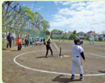
ティーボール教室

また、秋には区内の少年野球チームを中心とした「ティーボールフェスティバル」も行います。