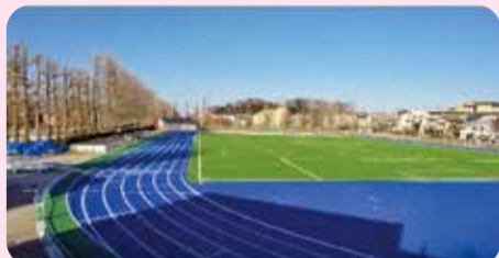
練馬総合運動場公園