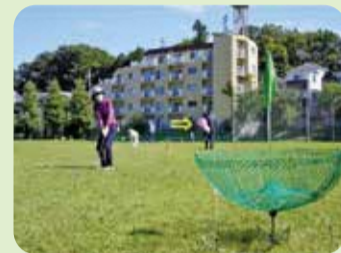
ターゲットバードゴルフ協会