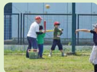
日本テーパーボール協会練馬区連盟