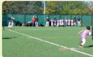
ティーボールフェスティバル