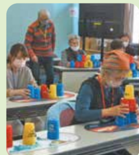
日本スポーツスタッキング協会