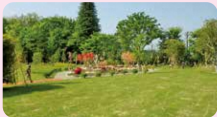
石神井松の風文化公園