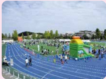
練馬まつり スポーツひろば