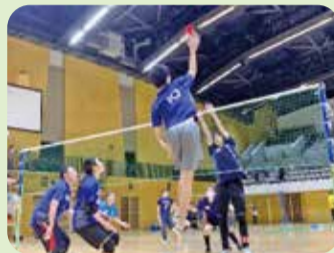
インディアカ協会