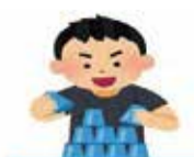
スポーツスタッキング協会

複数のプラスチック製カップを、決められた型に積み上げたり崩したりして、そのスピードを競うスポーツです。