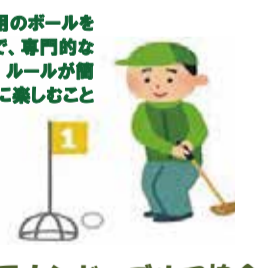
グラウンド・ゴルフ協会

木製のクラブと専用のボールを使う簡単なゴルフで、専門的な技術を必要とせず、ルールが簡単で、誰もが気軽に楽しむことができます。