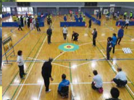
ユニバーサルスポーツフェスティバル