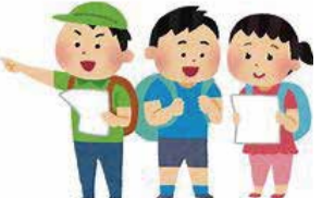
ウォークラリー研究会

コマ図と呼ばれるコース図に従って進み、途中で与えられた課題を解決しながら目的地を目指します。課題の点数とゴールした時間で順位が決まります。