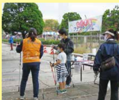
ねりすぽフェスティバル