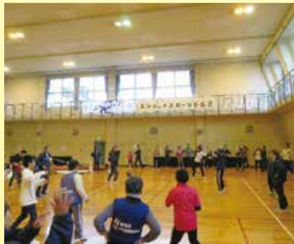
ねりまエンジョイスports DAY