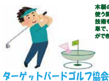
ターゲットボードゴルフ協会

羽根付きボールをマットの上に置いてクラブ1本で打ち、ゴルフカップの代わりに傘を逆さにしたようなネットホールに入れるゴルフをミニ化したスポーツです。