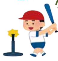
ティーボール協会

ティーボールはアメリカ発祥の野球型ニュースポーツです。最近では学校の授業で科目として取り入れ、ピッチャーのいないソフトボールに似たスポーツとして楽しまれています。