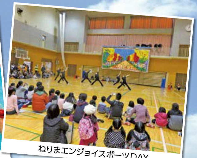
ねりまエンジョイスports DAY