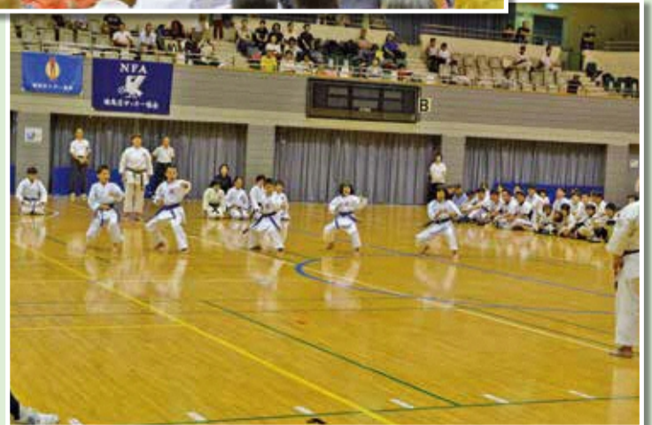
空手道連盟 エキシビション