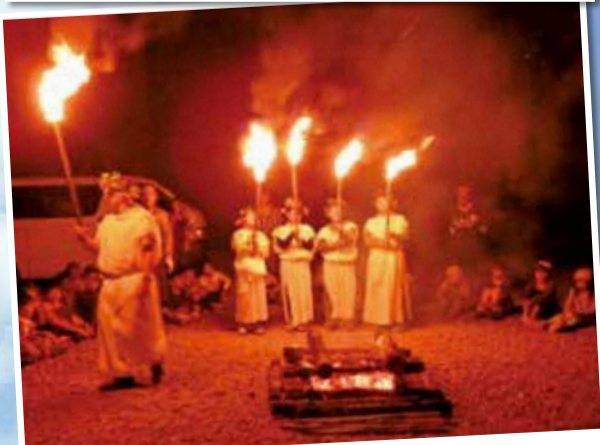
わんぱくキャンプ