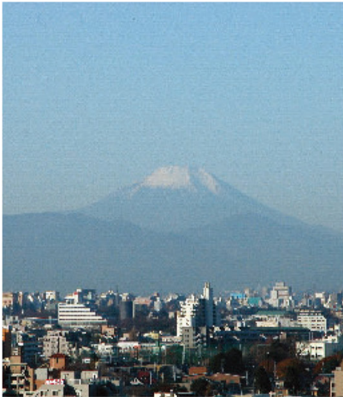
練馬区役所からの眺め（富士山、光が丘、都庁方面）

編集・発行 練馬区議会 〒176-8501 練馬区豊玉北六丁目12番1号 電話(3993)1111(代) FAX(3993)2424 http://www.city.nerima.tokyo.jp/gikai/