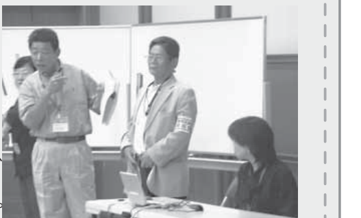
ひまわりネットワーク

【質疑応答】 Q: 将来のまちづくりへの展開はどう考えているか? 今年の活動をきっかけに交流を深めてネットワークを広げ、今後は周辺町会にも広げていきたい。現在は、おまつりの打合せなどを通じて、喫茶コーナーの存在を他の町会の人にも伝えている。