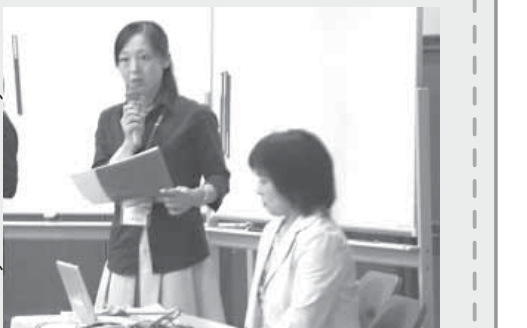
eコミュニケーションねりま

Q メーリングリストは閉鎖的なので、電子掲示板やオフ会など、地域に開いた形にしてはどうか。 →最初はリスクを考慮してMLといった限定した形を考えたが、今後はBBSなどを設けて、地域に広げていきたい。